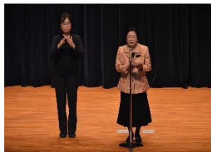
城間幹子那覇市長あいさつ