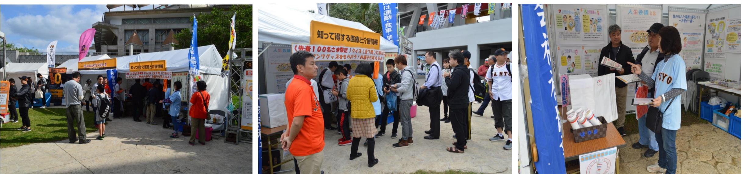
来場者へそれぞれのパネルを理解したうえでクイズを行ない、全問正解者にはジャイアンツグッズをプレゼント！！