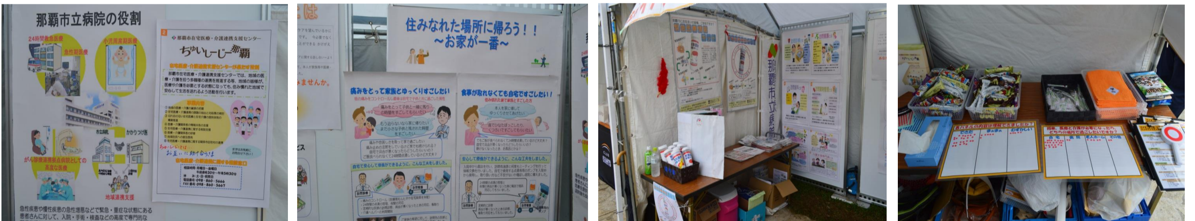
ちゅいしーじー那覇・那覇市立病院・那覇市社会福祉協議会の3者でパネルを出し合っイベントを行ないました。